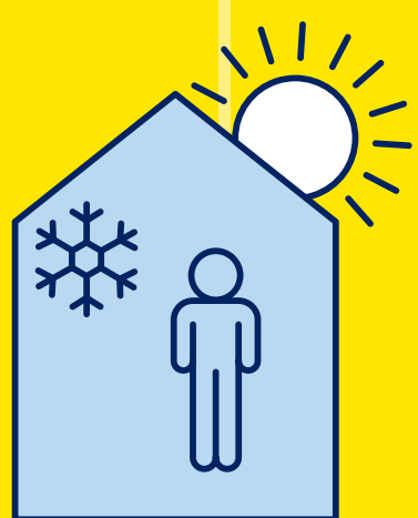
RESTEZ AU FRAIS