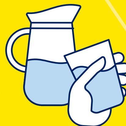
BUVEZ DE L'EAU